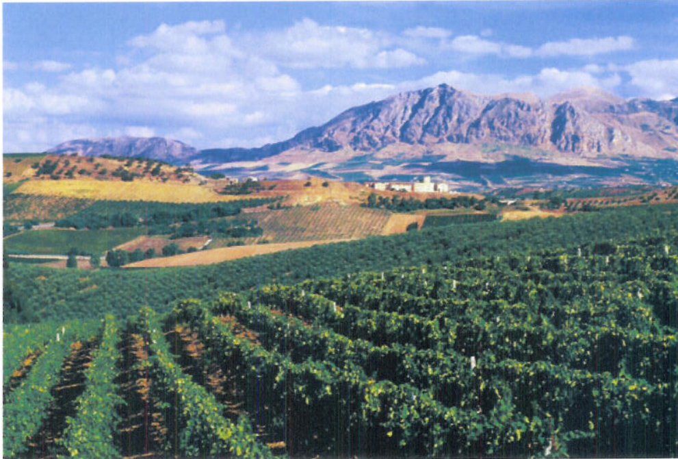
Weinlandschaft nahe Palermo

Einladung zur Probe „Mediterrane Inselweine“ am 20. Februar 2013 um 18:30 Uhr im Hotel Steigenberger, Bad Homburg